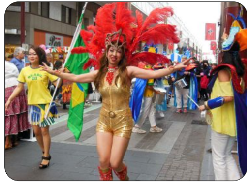
サンバの踊りと一隊が現れ、アーケードには華やかな雰囲気、一転、参加者と楽しく踊りました