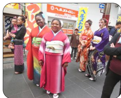
着物体験コーナーで和服を着せてもらい、ごきげんな留学生ら

第22回熊本国際交流祭典が平成27年11月7日、熊本市の健軍商店街「ピアクルス」で開催されました。県日中協会は今年もグルメコーナーに参加。ワンタンスープと中華菓子の麻花(マーファ)、芝麻菓(ジーマーガ)を販売しました。すっかり定番の人気商品となった麻花は、形状から「よりより」とも呼ばれます。小麦粉に少しの卵と砂糖を加えただけの素朴な味