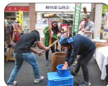
威勢の良い掛け声が響く、県国際農友会の餅つき