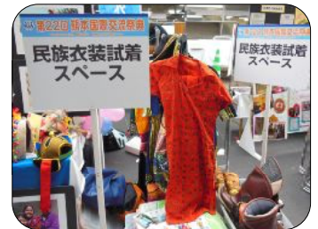
各国の試着が体験できるコーナーもあり、異国文化に触れていました