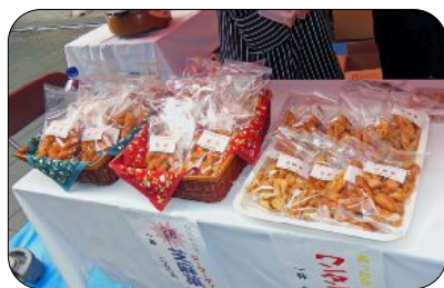
綺麗に袋づめて、シールを貼った子の麻花と芝麻菓