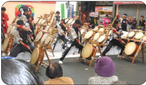
五ツ太鼓「彩流」の演奏が始まると、会場はパンチの利いた響きに見入っていました