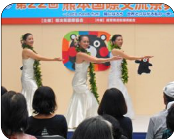
恒例となったハワイアンダンス。爽やかな音楽に乗って見事なダンスを披露しました