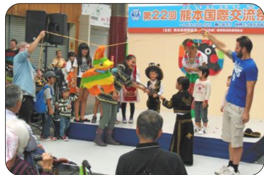
外国の子もその賑わいを見せました。会場は