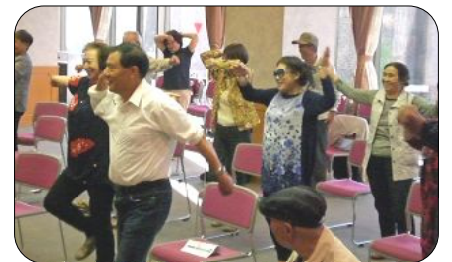
皆さんとっても楽しそう

実施などを積極的に手伝ってくださり、帰国者の皆さんともすっかり打ち解けていました。