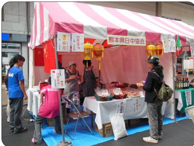
今年はとてもカラフルな協会のテント。ワンタンスープや中華菓子を買いに、途切れることなくお客さんが訪れていました