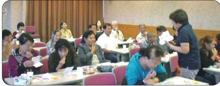
鏡を覗き込みながら、歯磨きブラシを使って歯を磨く参加者

中国帰国者（日本に永住帰国した中国残留邦人とその家族）を対象とした「楽しい健康づくり講座」が、10月19日、熊本市国際交流会館で開かれました。