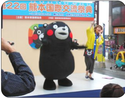
今年もくまモンが出演。大いに会場を盛り上げました