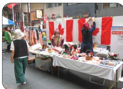
様々な雑貨が並んだ日協会のバザーのブース

で、噛めばほんのり甘く、癖になる味です。同じ生地にも黒ごまと白ごまをたっぷり加えてカリッと揚げた芝麻菓や皮から手作りのふっくらワンタンのスープも大好評。前日から準備に大わらわだったスタッフも、お客さんの笑顔に疲れが吹き飛びました。