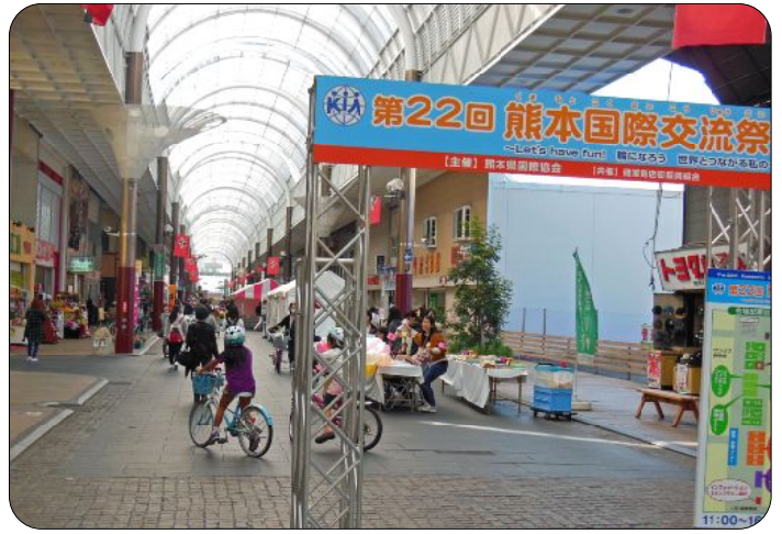
ピアクレスのアーケード街に会場ゲートがお客さんを出迎えました