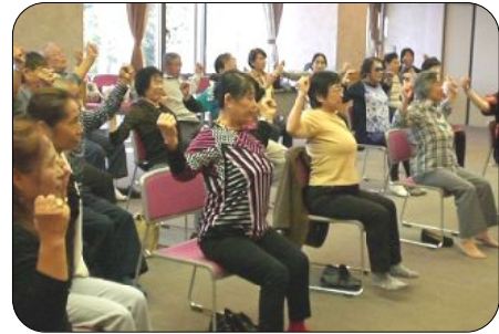
肩甲骨をしつかり動かしましょう。皆さんの肩からはホモホキッと音が。