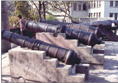
アヘン戦争の歴史を伝える四方砲台。広州博物館の庭に鎮座しています。