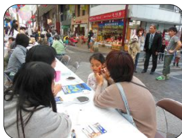
フェイスペインティングのコーナーで、頬に国旗を描いてもらう子ども

第22回熊本国際交流祭典が平成27年11月7日、熊本市の健軍商店街「ピアクルス」で開催されました。県日中協会は今年もグルメコーナーに参加。ワンタンスープと中華菓子の麻花(マーファ)、芝麻菓(ジーマーガ)を販売しました。すっかり定番の人気商品となった麻花は、形状から「よりより」とも呼ばれます。小麦粉に少しの卵と砂糖を加えただけの素朴な味