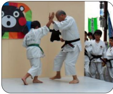
少林寺拳法の演武では祖父と孫が熱演。盛んな拍手を浴びていました