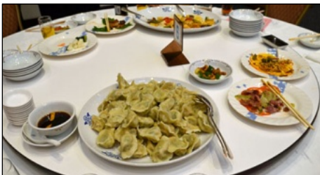
今回も餃子が人気を集めました