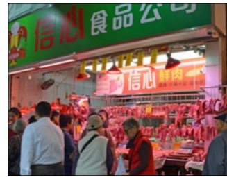
路地の店に吊るされた肉の山々

は驚き。ロビーと搭乗口の入り口までは電車で移動。さらに飛行機までバス送迎といった具合。