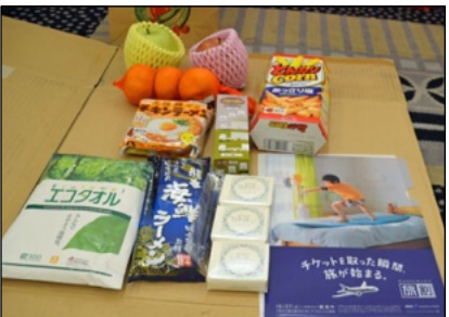
お土産の中身の一例です