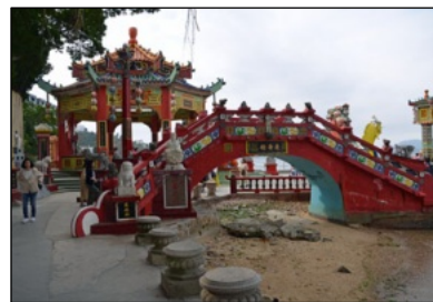
近年はパワースポットとしても注目されている天后廟の庭