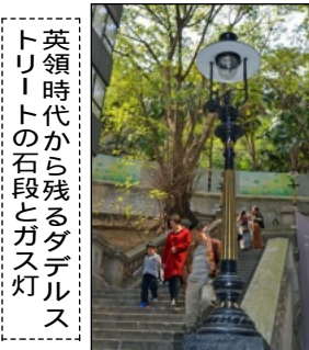
英領時代から残るタダレストリートの石段とガス灯