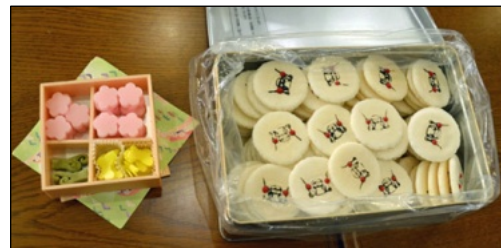
茶道コーナーで出された手作りのお菓子