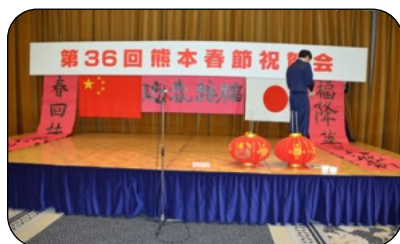
会場の看板準備中です