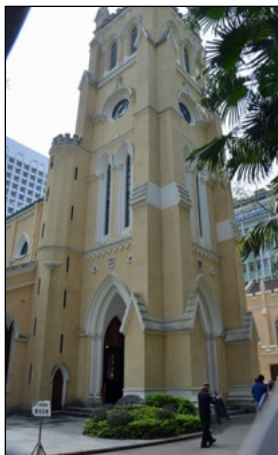
香港の歴史を見続けてきたセント・ジョーンズ大聖堂

つ大量のコンテナが港湾を埋め尽くす。世界貿易の大拠点を彷彿とさせる、勢いを体感しました。