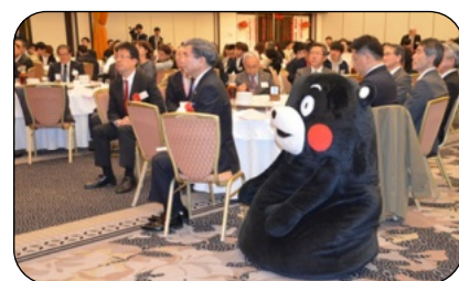
くまモンも正座で挨拶に耳を傾けました