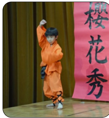
日本嵩山少林拳連盟の皆さんの迫力ある演武