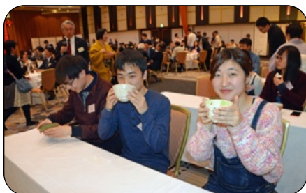
お茶のお手前に笑顔の 留学生たち