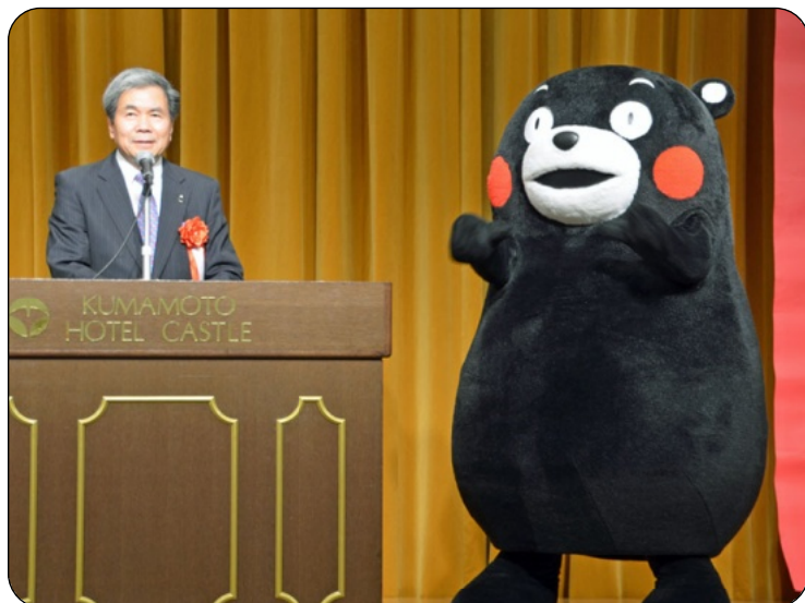
蒲島知事が来賓あいさつ。くまモンも横で拍手