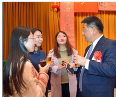
総領事と談笑する留学生たち