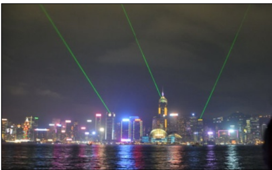
百万ドルの夜景を照らすビーム光線。3月2日がイベント最後でした

物価は中国本土とほぼ同じ位で、一ドルが日本円で約十四円。ビルと港の合間を縫うように発着していた以前の空港の跡地は、今も利用されないまま。沖合に造られた新空港の大きさに