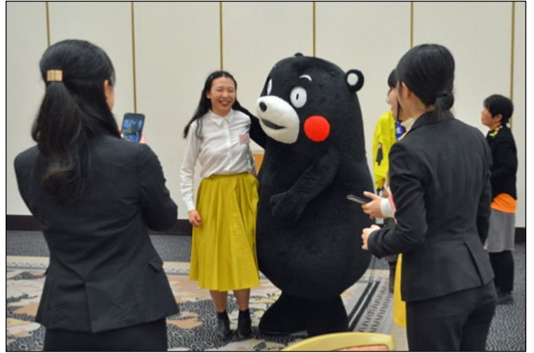
留学生と記念写真に収まるくまモン