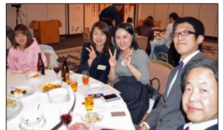
楽しそうにVサイン