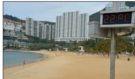
香港屈指のリゾート地、レパルスベイ。この日は気温22度でした

は驚き。ロビーと搭乗口の入り口までは電車で移動。さらに飛行機までバス送迎といった具合。