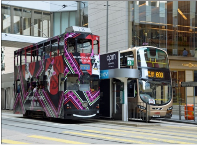
軌道が空いていればバスも通行可 (奥がバス、手前が電車)

の春。狭い土地にひしめくビル群、交通網は今も昔も同じ。二階建て電車の軌道も、空いていれば二階建てバスが走る。沿道の看板やマンションの窓から突き出した洗濯物の竿が当たりそうでした。