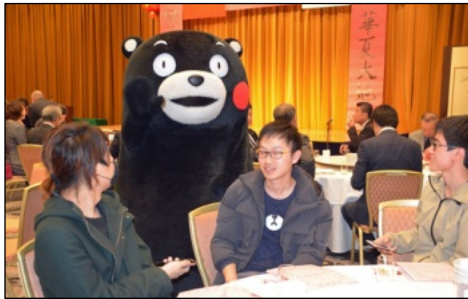
突然の来場に驚いた様子の留学生たち